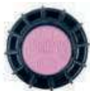
Identifikačný kryt úžitkovej vody pre PGJ

Dostupný ako štandardne nainštalovaný pri všetkých modeloch